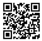
第5回・第6回 せきラボ申込はこちら